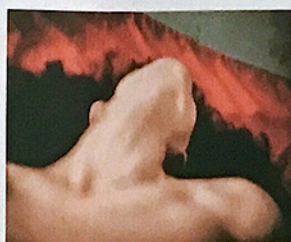
2004年攝於墨西哥的109號作品。