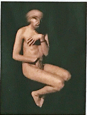
1998年攝於德國漢堡的018作品。

上月底，這位特立獨行的攝影大師於本港舉行個人展覽，是次名為 Contamination 的展覽（至5月25日），將展出 Antoine d'Agata 30幅彩色及黑白照片，同場另設有短片錄像裝置，以供公眾免費欣賞。d'Agata 更將親身抵港到現場與傳媒友好、收藏家見面。