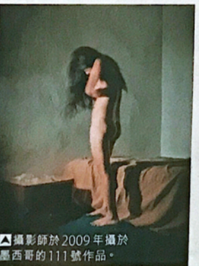
攝影師於2009年攝於墨西哥的111號作品。

在過去10年，他積極參與吳哥攝影節 (Angkor Photo Festival)，為兒童和年輕人免費舉辦攝影工作坊。